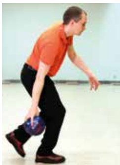
Puoli askelta etuajassa

Ajoituspiste 1 on se kohta, jossa pallo on alakuolokohdassa menossa taaksepäin (käsi on suoraan alaspäin olkapäätästä).